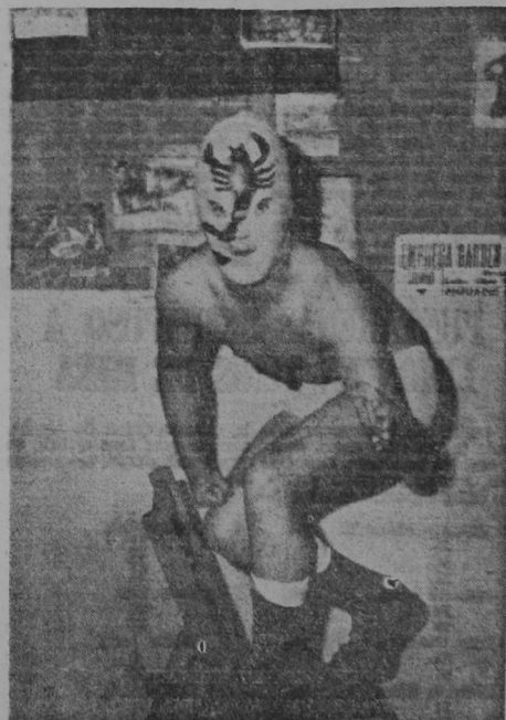
"EL ESCORPIÓN NEGRO" es el nombre de guerra adoptado por este joven luchador. Iniciándose en el rudo deporte de la lucha, se va adaptando fácil y rápidamente a sus secretos y trucos hasta ser considerado como los más aventajados que forman el grupo de los rudos. Valentía, temperamento y temple, le hacen temible entre